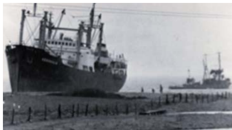
Et sjovt gammelt billede fra 1971, Stranding af skib nord for Refsnæsgården

Arkivet laver en lille udstilling, til sommerfesten den. 2. juni, så kig forbi.