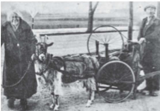
Et sjovt gammelt billede fra begyndelsen af 1930 af et Skærslipperpar på Røsnæs, de malkede geden og drak mælken.

Arkivet har åbent hver mandag kl. 14.00 – 16.00 Dog holder vi ferie sammen med skolen.